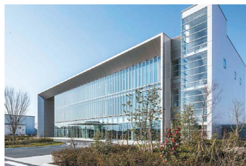
つば未来センター

こうした体制の必要性を痛感したのは、数年前に若手社員の一人を大腸がんで失うという悲劇があったからです。彼は定期健康診断で疑いが指摘されていたにもかかわらず忙しのために再受診を受けられず、結果として症状が悪化してしまっ。それ以来、組織を挙げて受診勧奨に取